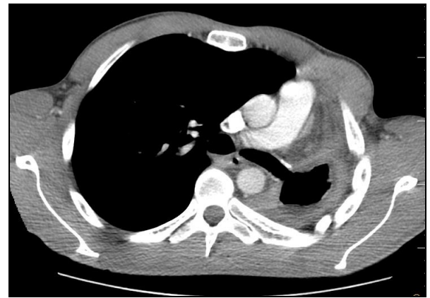
Şekil 1. Toraks BT mediasten kesitinde sol pnömonektomi kavitesi ve sol ana bronş ile pleural boşluk arasındaki fistül görülmekte.

pnömonektomi alanında kavite ve ampiyem düşündürür yoğun dansiteli sıvı görünümü izlendi. Sol ana bronş güdüğünün uzun segment olarak bırakıldığı ve bu alanda geniş bir BPF geliştiği saptandı (Şekil 1 ve 2). Anamnezinden 10 yıl önce ateşli silahla yaralanma sonrası sol pnömonektomi ve splenektomi operasyonu geçirdiği öğrenildi.